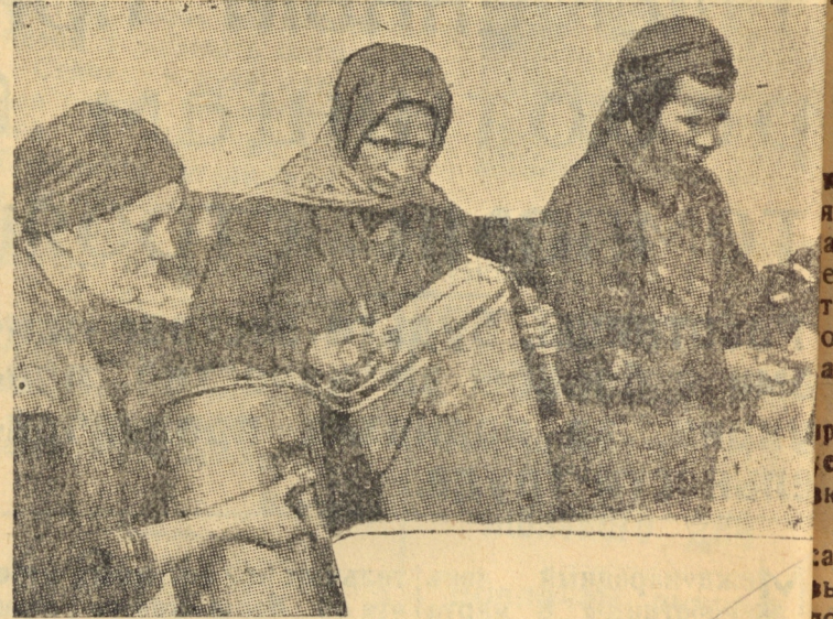
Ударная бригада женщин-маляров.