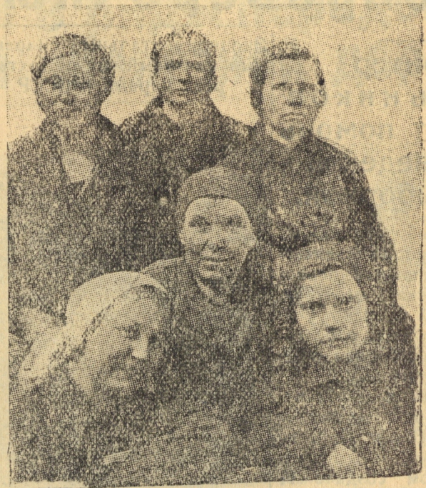
Первая женская парт. группа ВРЗ.

Подрастающий молодняк ясно говорит о том, что влияние чистой породыности